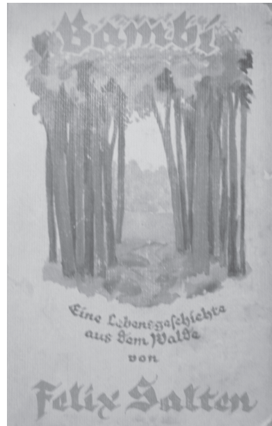
Salten, F.: Bambi. Eine Lebensgeschichte aus dem Walde . Ullstein Verlag, Wien 1923.

Als Tierroman ist Saltens Bambi in mehrere Zusammenhänge zu stellen. Im Vergleich mit klassischen Tiererzählungen kommt als Vorläufer Rudyard Kiplings Dschungelbuch (1894/95, dt. 1898) in Betracht, das auch als Prototyp der kolonialen Literatur gilt. Beiden gemeinsam ist das, wenn auch unterschiedliche, Leben unter Tieren mit, ebenfalls divergierender, Beziehung zum Menschen. Von unmittelbarem Einfluss dürften aber die Tierbücher von Ebner-Eschenbach gewesen sein, mit der Sal-