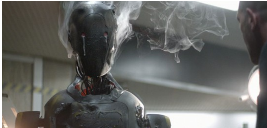
Abbildung 10: Ein weinender Roboter? – Gabe Ibáñez (2014): Automata , TC: 00:23:33

lässt, wobei diese häufig auf Menschen verweisen, die marginalisiert etc. werden.