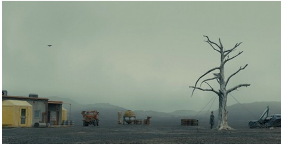
Abbildung 1: Der abgestorbene Baum – Denis Villeneuve (2017): Blade Runner 2049, TC: 00:10:26

Im weiteren Verlauf bemerkt Joe unter dem Baum eine Blume. Davon aufmerksam gemacht lässt er von einer Drohne das Erdreich unter dem Baum untersuchen und findet etwas: Die Weiterführung der Untersuchung wird ergeben, dass Joe die sterblichen Überreste einer Replikantin entdeckt hat, die bei der Geburt ihres Kindes gestorben ist. Die Blume war – sehr wahrscheinlich von dem Replikanten, der die Farm bewohnt hatte – auf dem Grab der Replikantin niedergelegt worden und hat es gewissermaßen markiert bzw. für Joe auffindbar gemacht.