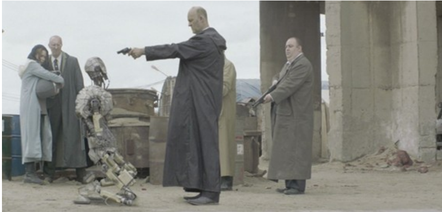
Abbildung 11: Hinrichtung eines Roboters – Gabe Ibáñez (2014): Automata, TC: 01:34:03