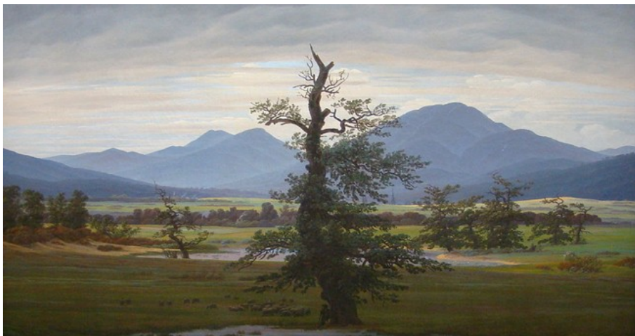
Abbildung 2: Friedrich, Caspar David (1822): Dorflandschaft bei Morgenbeleuchtung / Einsamer Baum

ten beerdigt sind, dieser Menschen auf spezielle Weise gedenken (z. B. indem sie Blumen auf Gräbern niederlegen). – Im Kontext von Blade Runner 2049 und der Frage, ob Replikantinnen und Replikanten wie Menschen sind bzw. Menschen sind, ist die Szene äußerst relevant, weil offenbar ein Replikant einer Replikantin gedacht und dadurch Menschlichkeit erwiesen hat.