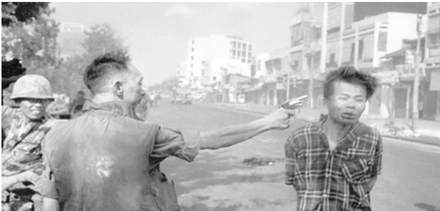
Abbildung 12: Hinrichtung eines Menschen in Vietnam

In literarischer Hinsicht erzählt der Film nicht nur das Buch von Philip K. Dick Träumen Androiden von elektrischen Schafen? (Dick