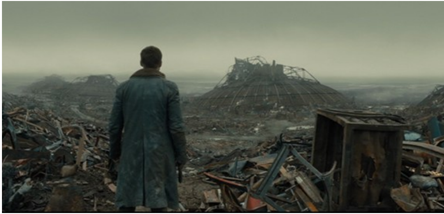
Abbildung 3: Der Wanderer über dem Müllmeer – Denis Villeneuve (2017): Blade Runner 2049, TC: 01:03:26

Dieses Filmbild ist dazu geeignet, an Caspar David Friedrichs Bild Der Wanderer über dem Nebelmeer zu erinnern: