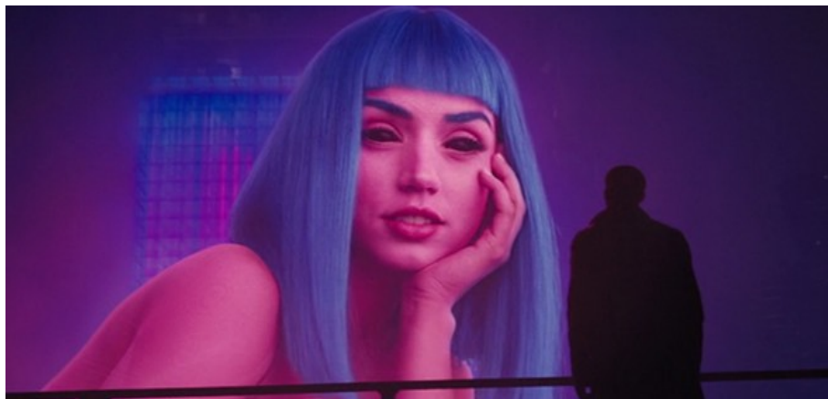
Abbildung 5: „What a day, hm?“ –

überdimensionalen Werbehologramm begegnet, einer nackten Frau, die ihn anspricht, wobei sie Folgendes zu ihm sagt: „Hello handsome. [Pause] What a day, hm? [Pause] You look lonely. I can fix that. [Pause] You look like a good Joe.“ – Während K durch seine jüngsten Erlebnisse geschunden ist, zeichnet sich das Frauenhologramm durch körperliche Perfektion aus und mag die künstliche Intelligenz Joes – Joi – auf eigentümliche Weise spiegeln und ließe sich als deren erotische und lustbetonte holografische Verkörperung interpretieren. Hierfür spricht auch, dass die künstliche Intelligenz Joes – Joi – Joe in seiner Wohnung ebenfalls mit „What a day“ angesprochen hat. – Das überdimensionale Frauenhologramm und Joe stehen in einem deutlichen Kontrast zueinander.