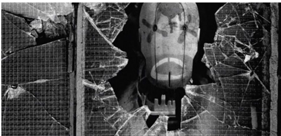
Abbildung 9: Ein verspotteter Roboter? – Gabe Ibáñez (2014): Automata , TC: 00:06:29

doch Selbstbestimmung erlangen, gehört in Automata beispielsweise eine künstliche Intelligenz, die für Prostitution konzipiert worden ist (vgl. A.I. – Künstliche Intelligenz [USA 2001]). Ebenso sind versehrte Roboter in einer Art Ghetto zu sehen und Roboter, die gewissermaßen verspottet bzw. geschändet worden sind.