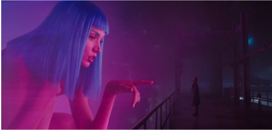
Abbildung 6: „You look lonely.“ –

Denis Villeneuve (2017): Blade Runner 2049, TC: 02:11:03