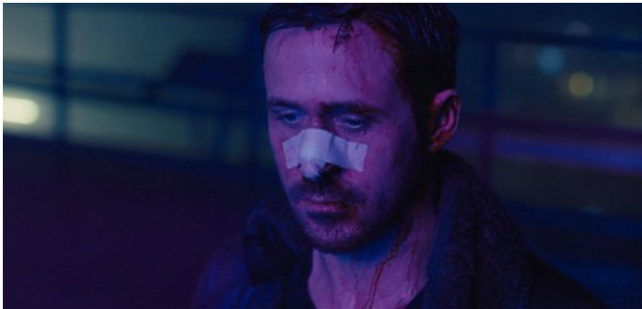
Abbildung 7: Der geschundene Joe – Denis Villeneuve (2017): Blade Runner 2049 , TC: 02:11:03

Für einen Bildvergleich in Zusammenhang mit der Ecce-homo-Szene scheinen hier viele Werke aus weiteren Epochen passend und ertragreich (s. u.). Bei den diversen Übersetzungen der Bibelstelle (Joh 19,5) wird deutlich, dass neben dem Hinweis auf die konkrete Person Jesu eine anthropologische Dimension bedeutsam ist, die auch in bildnerischen Adaptionen der Ecce-homo-Szene ausgemacht werden mag. – Davon, dass mit dem Finger auf Jesus gezeigt wird (so wie das Frauenhologramm mit dem Finger auf Joe deutet), ist zwar im biblischen Text nichts zu lesen – die Aufforderung „Ecce homo“ lässt aber eine solche Gestik (im Rahmen einer imaginativen bzw. künstlerischen Bebilderung der Szene, von der unklar bleiben muss, ob sie tatsächlich stattgefunden hat) naheliegend bzw. passend erscheinen, weshalb sie sich auch in einigen künstlerischen Darstellungen dieser Szene niederschlagen haben dürfte (z. B. Tizian: Ecce homo ). Der Fingerzeig er-