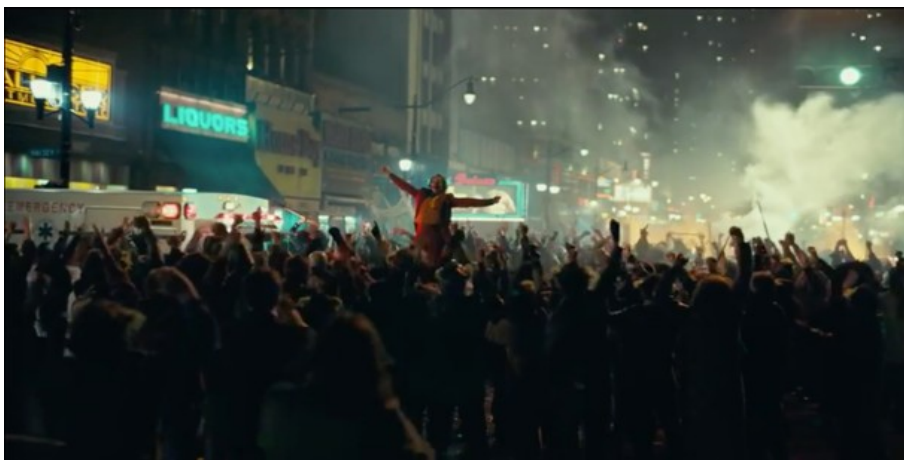
Abbildung 12: Todd Phillips, JOKER – TC: 01:52:05.801