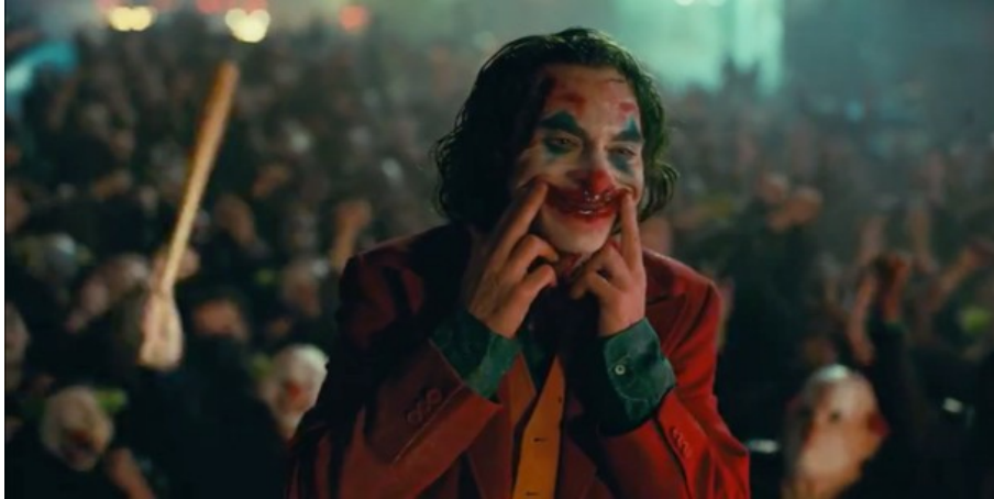
Abbildung 11: Todd Phillips, JOKER – TC: 01:51:40.725