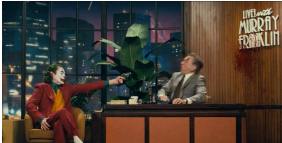
Abbildung 10: Todd Phillips, JOKER – TC: 01:45:03.721