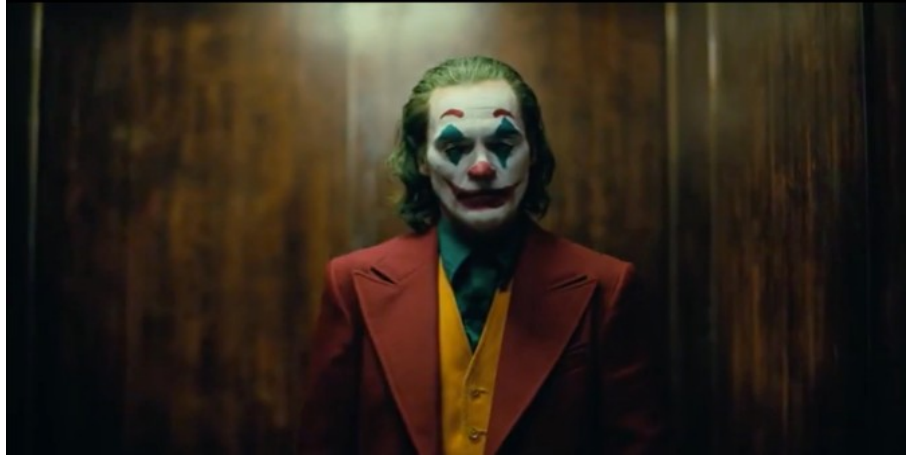
Abbildung 2: Todd Phillips, JOKER – TC: 01:30:24.218