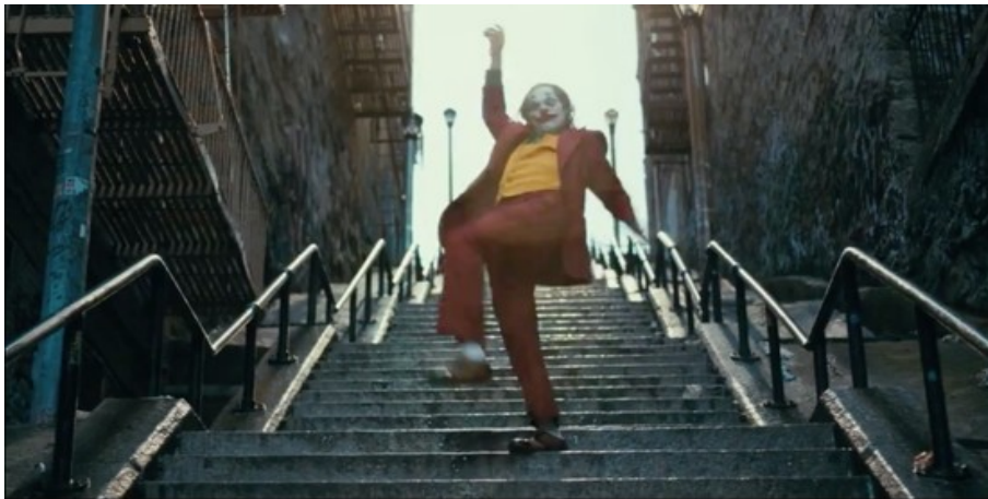
Abbildung 3: Todd Phillips, JOKER – TC: 01:30:43.054