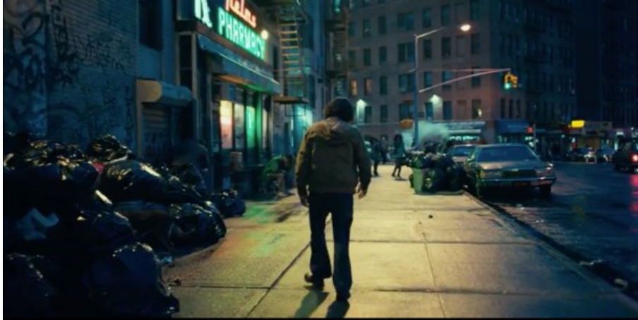
Abbildung 6: Todd Phillips, JOKER – TC: 00:09:16.107