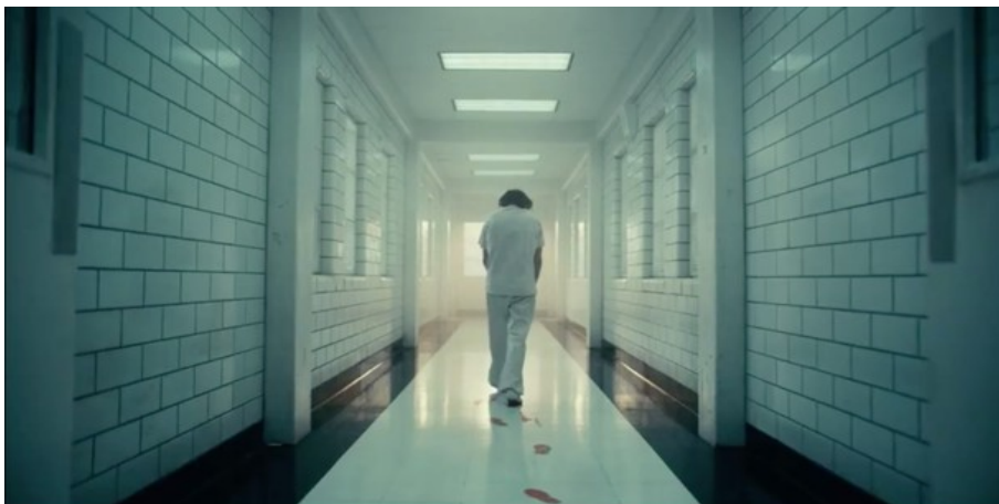
Abbildung 15: Todd Phillips, JOKER – TC: 01:54:32.053