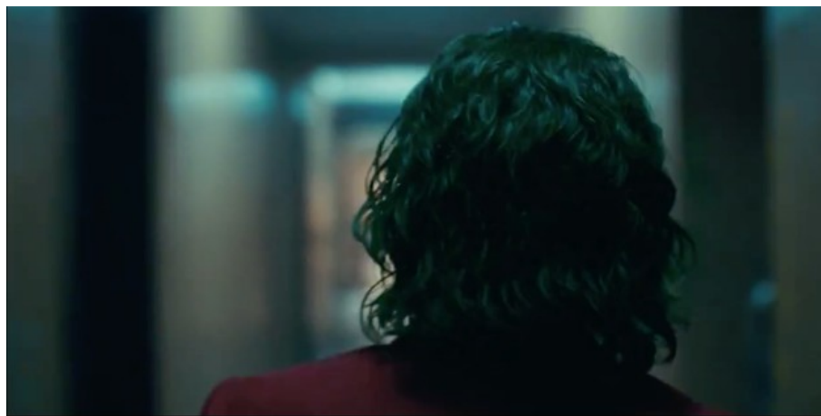
Abbildung 1: Todd Phillips, JOKER – TC: 01:30:12.692