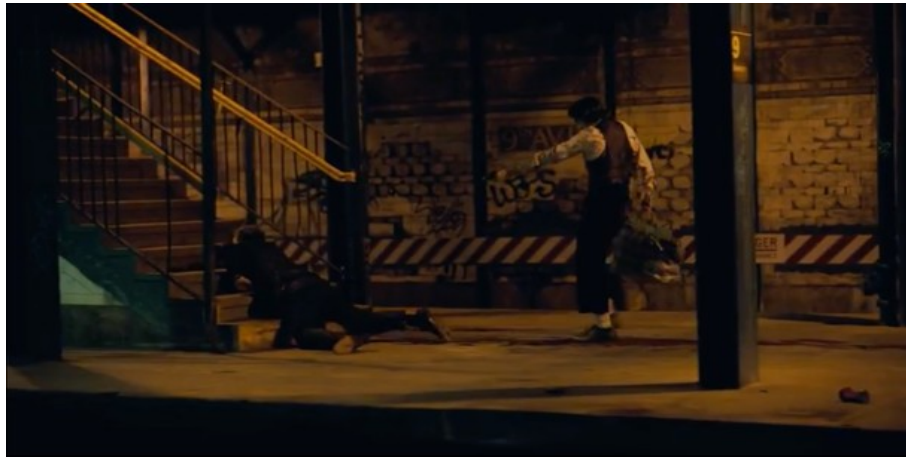
Abbildung 9: Todd Phillips, JOKER – TC: 00:33:31.099