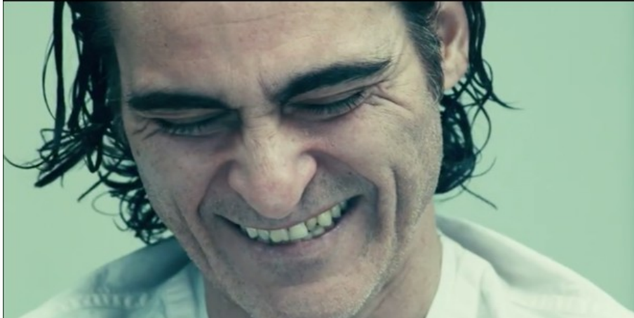
Abbildung 14: Todd Phillips, JOKER – TC: 01:52:34.701 © Warner Brothers