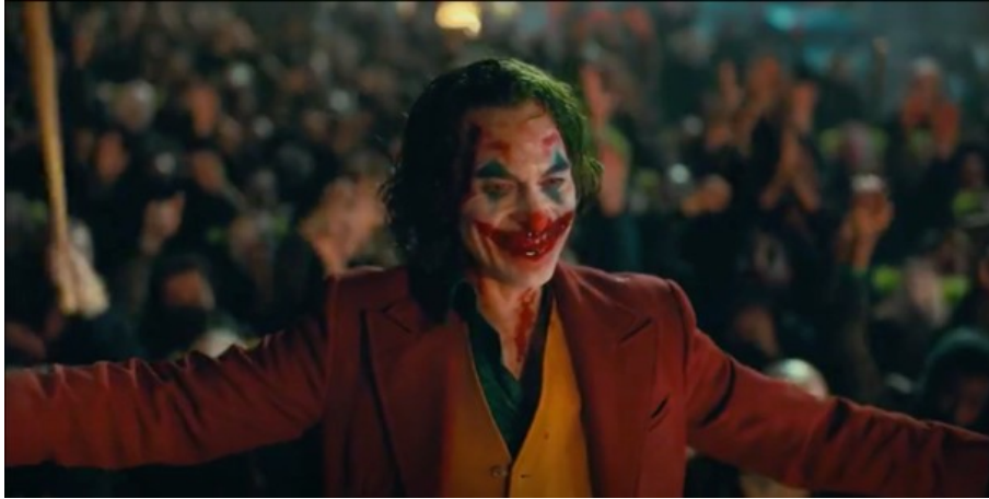
Abbildung 13: Todd Phillips, JOKER – TC: 01:51:48.375