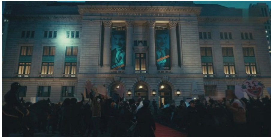
Abbildung 5: Todd Phillips, JOKER – TC: 01:02:18.195