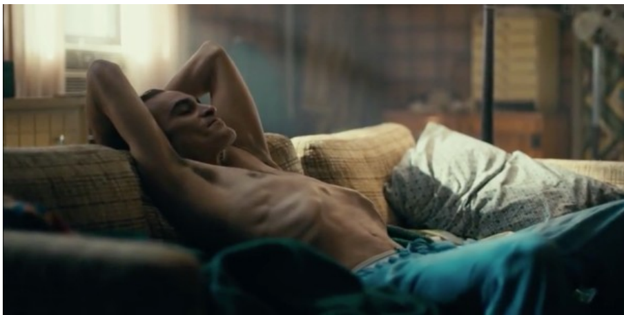
Abbildung 7: Todd Phillips, JOKER – TC: 00:39:23.529

Auch am Lebensstil von Arthur und seiner Mutter lässt sich erahnen, wie schwer die Zeiten sind und dass sie am Existenzminimum leben. Sie wohnen in einer kleinen Wohnung in einem alten, herabgekommenen Haus und vor allem Arthur ist extrem dünn, sein Oberkörper – auch als „Symptom“ der Gesamtgesellschaft – abgemagert und ausgemergelt (vgl. Phillips 2019).