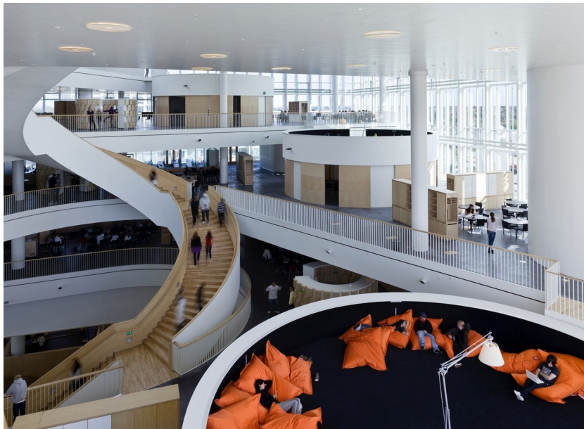
Abbildung 2: Lernlandschaft des Ørestad-Gymnasiums, Kopenhagen

und leben. Das räumliche ‚Herz‘ der Schule wird dabei durch eine gigantische, über fünf Stockwerke reichende Treppe gebildet, um die herum sich eine beeindruckende Vielfalt an „Passagen, Öffnungen, Teilräumen und Nischen“ (Höhns 2009: 23) gruppiert: von transparent gehaltenen Lernbereichen über offene Fachräume bis hin zu kreisrunden Auditorien, deren Inneres für Präsentation und Gruppenarbeiten genutzt werden kann, während das Dach eben jener Auditorien, ausgestattet mit Kissen und Sitzsäcken, als Entspannungs- und Rückzugsbereich zur Verfügung steht (siehe Abbildung 2).