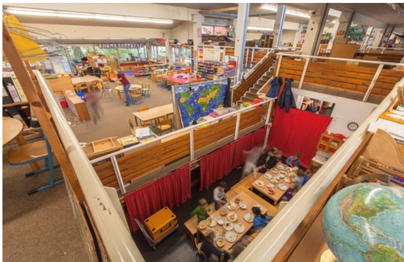
Abbildung 3: Lernlandschaft der Laborschule Bielefeld

nungen auszubalancieren versucht: Es geht hier in erster Linie um eine flexible, dezentralisierte Nutzung digitaler Medien, ergänzt durch einzelne Teilbereiche, die ganz gezielt auf Zentralisierung ausgerichtet sind – eben jene Auditorien (vgl. Montag Stiftung Jugend und Gesellschaft 2017: 333). Fehlen solche Rückzugsbereiche allerdings, droht schnell das Gleichgewicht verloren zu gehen: wie etwa an der Laborschule Bielefeld – ebenfalls einer Lernlandschaft –, an der kaum visuell und akustisch geschützte Bereiche vorhanden sind, während gleichzeitig wegen des allgegenwärtigen Tageslichts auch kein problemloser Einsatz von Projektoren möglich ist (siehe Abbildung 3).