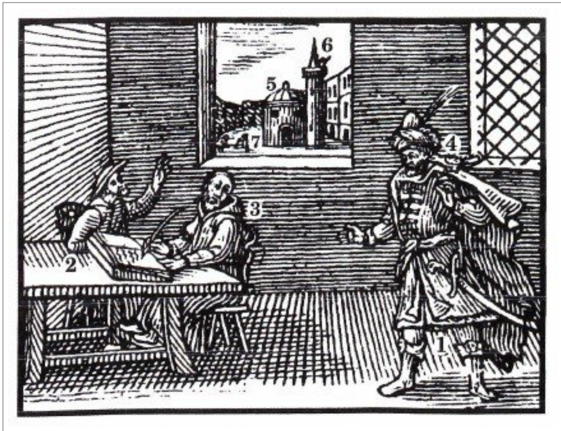
Abb. 2: Die Darstellung des Islam im Orbis sensualium pictus (Comenius 2012: 308).

Stehend ist hier der Krieger Mohammed abgebildet, sitzend seine zwei Berater.