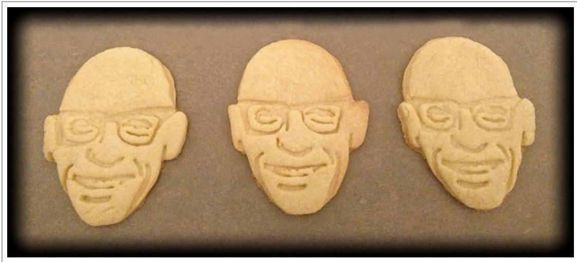
Abb. 2: Mythos von Teuth – Foucault-Keks