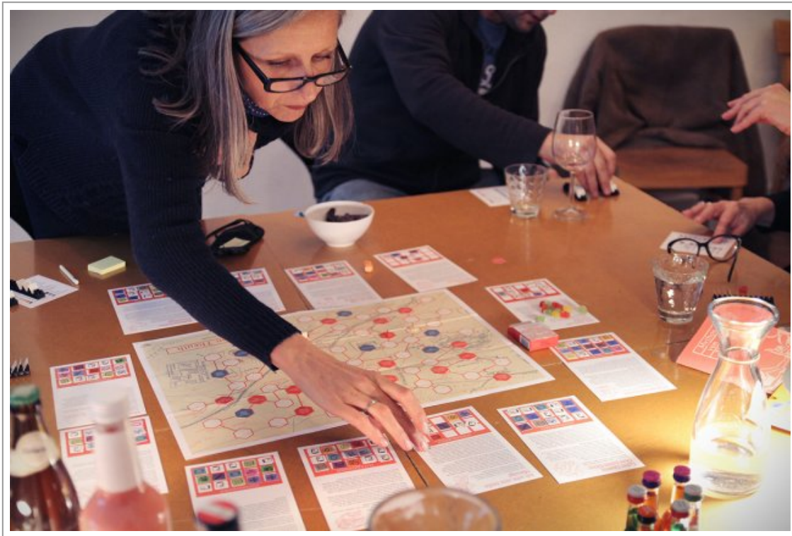
Abb. 5: Mythos von Teuth – Im Spiel