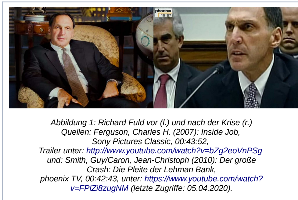
Abbildung 1: Richard Fuld vor (l.) und nach der Krise (r.)

nen sich ausdehnten, in demselben Maße entwickelte sich die Bourgeoisie, vermehrte sie ihre Kapitalien, drängte sie alle vom Mittelalter her überlieferten Klassen in den Hintergrund. 2