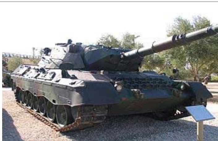
Abbildung 2: Der Leopard-1-Panzer

mindest kalte FüÙe einbrachte. Derartige Zusammenhänge korreliert die Autorin z. B. mit historischen Passagen zur erneuten Legitimierung von Leiharbeit, die zur „Lohnarbeit in drei Klassen“ zählt: „regulär ausgebeutete Lohnarbeit, Leiharbeit, Werkvertrag“ (80), und hält dabei fest, dass immer mehr Menschen sich für immer schlechtere Löhne kaputtarbeiten müssen.