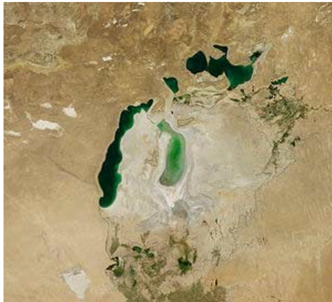
Abbildung 3: Der Aralsee 2011

zen, 150 Raketenwerfer. 160 Maschinenkanonen von Rheinmetall Defence AG, vier Fregatten und 12 U-Boote von Thyssen Krupp Marine Systems AG sowie 22 F-4 Phantom Kampfflugzeuge (nur eine Auswahl)“ (40). Diese Lieferungen verbindet die Autorin mit deutschen Friedenseinsätzen in – auch von Teilen der BRD kriegsstrategisch in die „Sozialstaatszerstörung“ gestürzten – krisengebeutelten Gegenden.