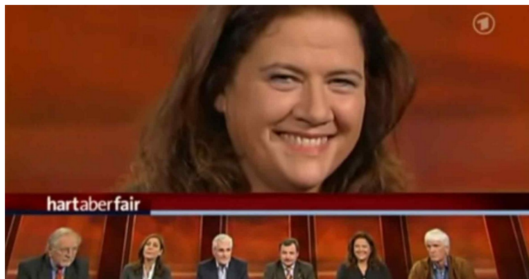
Abbildung 5: Jutta Ditfurth in Hart aber fair (2010), online unter: https://www.youtube.com/watch?v=aTUNHvzpigc (letzter Zugriff: 05.04.2020)

zudecken, welchen Tendenzen der weltweit integrierte Kapitalismus (Félix Guattari) folgt und was dabei alles falsch läuft. Ein Grund mehr, die politische Haltung der Demokratie auch in schweren Zeiten nicht zu verraten. Ein Grund mehr in der Zeit des Zorns auf die bestehenden Verhältnisse wütend zu sein. To be (dis)continued ...