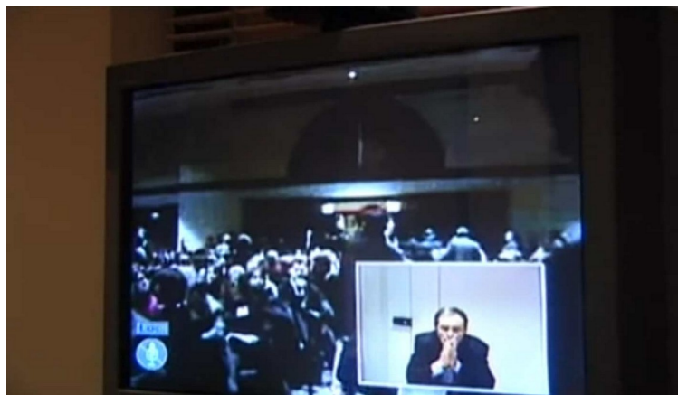
Abbildung 4: Bourdieu in den Medien, Quelle: Establishing Shot aus Carles, Pierre (2009): Soziologie ist ein Kampfsport – Pierre Bourdieu im Portrait (OmU), Filmedition Suhrkamp, 3 DVD-Box, Frankfurt/M.: Suhrkamp, 00:00:19.

lation des Klassenkampfes. Die Finanzmärkte operieren keineswegs reguliert, sondern funktionieren – nicht zuletzt durch Kapitalflucht – genauso wie zuvor und höhlen die Reste an Demokratie Stück für Stück durch Deregulierungen und Privatisierungen aus, an deren Ende kein öffentliches Eigentum, kein faires, gleiches und gemeinsames Bildungssystem und mithin auch keine Demokratie mehr existieren kann. All dies spricht – und ähnlich argumentiert Ditfurth – für die Tatsache, dass der Kapitalismus (auch und gerade in China) durch seine Monopolisierungstendenz totalitäre Züge trägt und gesellschaftliches wie tierisches Leben auf dem gesamten Globus zerstört.