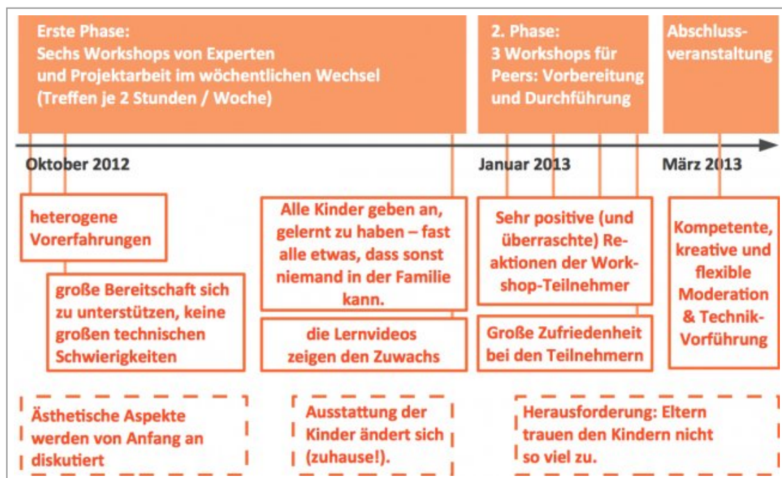
Abbildung 2: Ablaufdiagramm

Wir haben wieder das Ablaufdiagramm genommen, um die zentralen Ergebnisse der jeweiligen Untersuchungen aufzuzeigen. Wir konzentrieren uns dabei auf die Ergebnisse im Bezug auf die Medienkompetenz (vgl. Abbildung).