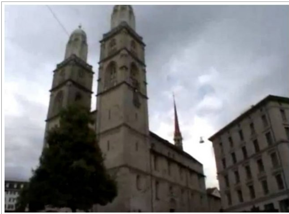
Abb. 2: Johannes Gees: SALAT 2007. Zunächst in Bern, später in Zürich und St. Gallen wurden umgebaute, mit MP3-Player und Timer bestückte Megaphone auf Kirchtürmen platziert. Zu regelmäßigen Zeiten schallte daraufhin das Gebet des Muezzins durch die Schweizer Innenstädte.