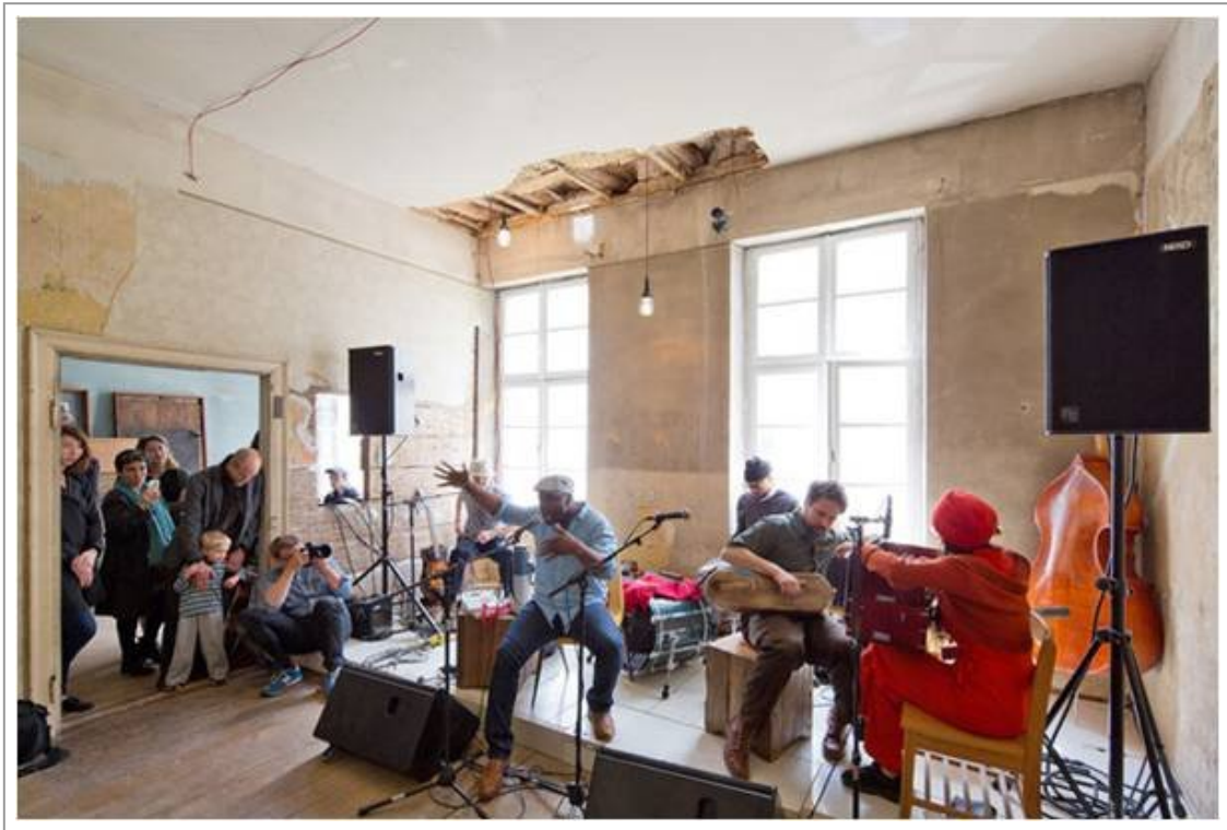
Abb. 7–10: Post Art, Impressionen d13: Pierre Huyghe, Tamas St. Turba, Baktrische Prinzessin, Theaster Gates. Mitte links: "An early example of marriage between media and activism, these 'devices' represent[...] a non-art art for and by all'." (Lucarelli 2012) Tschechoslowakei 1968. Nachdem Verbot des öffentlichen Rundfunks verbreiteten sich in der Bevölkerung diese Fake-Radios. Die Sowjet-Armee beschlagnahmte die "Geräte" dennoch. Unklar ist, ob versteckte Kommunikationsgeräte darin vermutet oder die Backsteine als anarchische Kunstwerke interpretiert wurden.

Die Krise, die den Übergang in die nächste Gesellschaft markiert, ist für die Kunst eine Katastrophe. Das hatte Régis Debray in seiner "Geschichte der Bildbetrachtung im Abendland" (Debray 1999) schon angekündigt. In gedanklicher Nähe zur Idee der nächsten Gesellschaft entlarvt er die Kunst (oder besser DIE Kunst) als ein Symptom der durch Buchdruck und Zentralperspektive geprägten Mediosphäre. Kunst ist demnach "kein unveränderlicher Bestandteil der conditio humana " und auch keine "transhistorische Substanz", die sich als anthropologische Konstante unverändert durch die Kulturgeschichte zieht, sondern ein erst "spät im