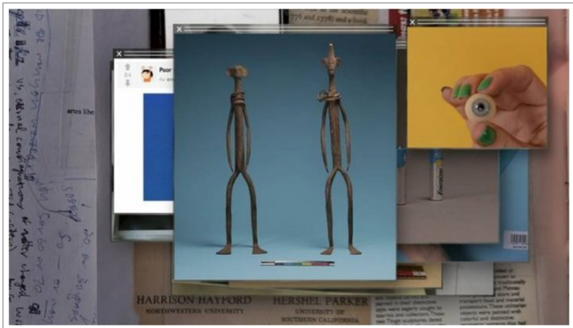
Abb. 13–15: Camille Henrot, La Grosse Fatigue , 2013. Postproduktion der Geschichte des Universums: mit Hip-Hop-Predigt der Schöpfungsgeschichte unterlegte Montage einer Folge von Pop-up-Fenstern aus Hunderten von Filmschnipseln.