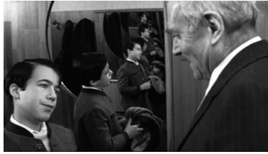
Abbildungen 22 und 23: The Boys from Brazil (1978), Franklin J. Schaffner, Vielfach-Hitler-Klon, Filmposter – plurale Zellteilung versus männliches Singulärsubjekt