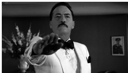
Abbildung 1: The Boys from Brazil (1978) ,Franklin J. Schaffner, Dr. Mengele/Gregory Peck aus der Untersicht mit Hitlerporträt

Seine weiße Kleidung, die auf den symbolischen Gehalt des weißen, von Autorität und Hygiene kündenden Arztkittel und auf eine vermeintlich ‚weiße Weste‘ anspielt, erstrahlt bei seinem ersten nächtlichen Auftritt im Scheinwerferlicht der Autos sei-