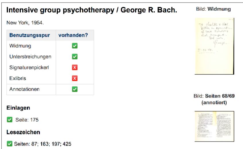
Abb. 2: „Angereicherte“ Exemplarspezifika

Für jedes Exemplar wurde eine eigene Seite im Wiki angelegt, auf der die Benutzungsspuren – übersichtlicher als in Listenform – präsentiert werden. Zusätzlich zu den in der Liste erfassten Exemplarspezifika können Scans eingebunden werden, die beispielsweise handschriftliche Widmungen oder Beilagen zeigen (siehe Abbildung 2). Interessierten NutzerInnen kann damit ein erster Eindruck der jeweiligen Benutzungsspuren vermittelt werden. Die Wiki-Seiten stellen keine Sackgassen dar, sondern können über die Signaturen zur Navigation innerhalb der Exilbibliothek verwendet werden. Mithilfe von Tags sind spezifische Einschränkungen möglich (zum Beispiel auf Bücher, die sowohl Widmungen als auch Annotationen enthalten).