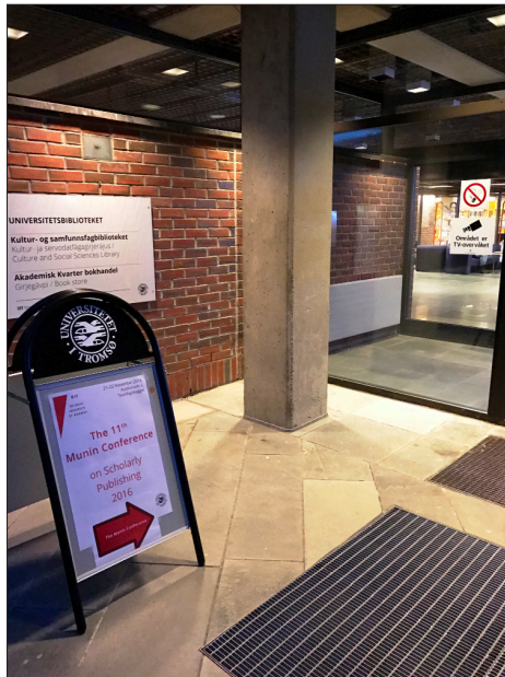
Abb. 1: Eingang zur Munin-Konferenz

Bereits zum 11. Mal fand heuer vom 21. bis 22. November die Munin-Konferenz an der Universität Tromsø statt. Die erste Tagung wurde anlässlich des Releases des institutionellen Repositoriums der Universität Tromsø, das sich „Munin“ nennt ( http://munin.uit.no/ ), initiiert. Zunächst war die Veranstaltung auf Norwegen beschränkt und wurde in norwegischer Sprache abgehalten. Schon bald meldeten sich internationale InteressentInnen und nun steht diese Konferenz, bei der Open Access, Open Data und Open Science diskutiert werden, für Vortragende aus allen Ländern offen. Obwohl in Tromsø genau am 1. Tagungstag die kälteste und dunkelste Zeit beginnt, wurde uns ein warmer und herzlicher Empfang in einem netten Lokal bereitet, bei dem die Gäste und die VeranstalterInnen Gelegenheit hatten sich kennen zu lernen, oder sich – einige sind ja schon jahrelang dabei – wieder zu treffen.