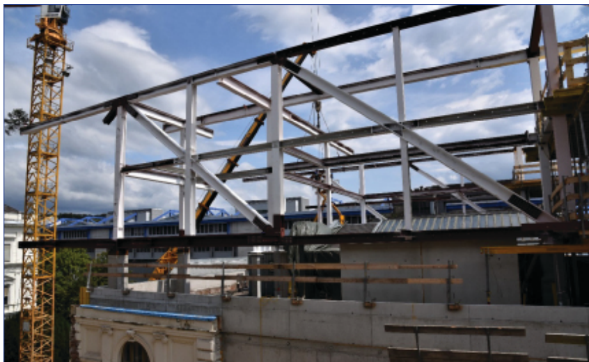
Abb. 1: Blick vom Hauptgebäude der Universität auf die Stahlkonstruktion des Glasriegels am Tag der Gleichfeier

Da eine abermalige Verschiebung der Gleichfeier wegen des damit verbundenen Imageverlusts nicht infrage kam, entstand die bizarre Situation, dass am 29. Juni 2018 etwas gefeiert wurde, was augenscheinlich bei Weitem noch nicht erreicht worden war.