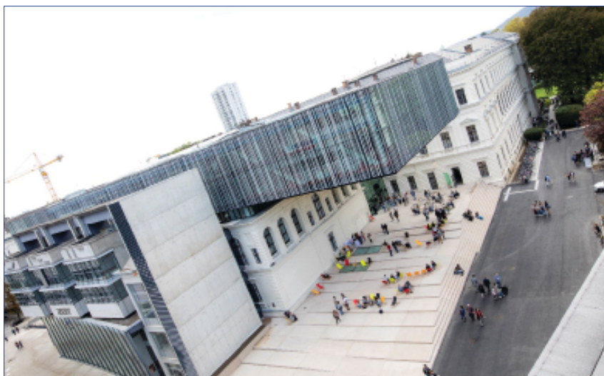
Abb. 7: Gesamtansicht des Gebäudes am Tag der Eröffnung

mit erheblichen Einschränkungen oder gar nicht wahrnehmbar. Große Teile des Gebäudes, wie die neuen Magazine, die Räume der Abteilung für Sondersammlungen inklusive Restaurierung und Digitalisierung, die Buchbinderwerkstätte sowie der 24/7-Bereich und die neuen Gruppenräume standen erst nach Monaten zur Verfügung, und der historische Lesesaal musste wiederholt für das Publikum gesperrt werden, weil die Arbeiten am Glastdach noch im Gange waren. An mehreren Stellen drang Wasser in die Räumlichkeiten, wodurch sich die Farbe von der Wand löste und der frisch verlegte Parkettboden aufwölbte. Die Klimasteuerung funktionierte unzureichend, am gesamten Gebäude fehlten Sonnenschutzeinrichtungen, die Garderobe konnte nicht in Betrieb genommen werden, die Buchförderanlage lief nur phasenweise und in einigen Bereichen – vor allem in den Magazinen – konnte das Licht nicht ausgeschaltet werden. Es existierte kein Leitsystem und die Lifte verzeichneten immer wieder Ausfälle oder waren längere Zeit durch Anlieferungen blockiert. Es gab keine intakte Videoüberwachung und es erforderte mehrere Anläufe, bis die Brandmeldeanlage abgenommen werden konnte.