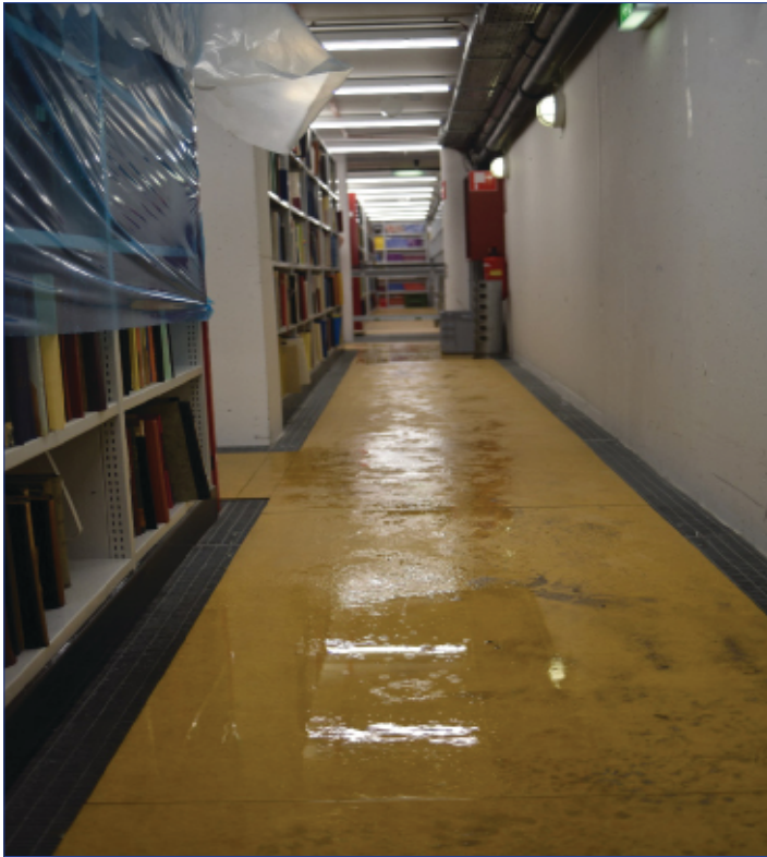
Abb. 5: Wassereintritt am Tag der Eröffnung

Für die publikumswirksame Eröffnungsveranstaltung am 26. September 2019 wurde mit großem Einsatz versucht, das gesamte Areal in einen dem Festakt angemessenen Zustand zu versetzen. Aus diesem Grund wurde ohne Wissen der Bibliotheksleitung in der Nacht davor eine Reinigung des umliegenden Freigeländes mit einem Spritzwagen veranlasst, was zur Folge hatte, dass am Morgen der Eröffnung ein massiver Wassereintritt im Tiefspeicher der Bibliothek und in mehreren Nebenräumen gravierenden Schaden anrichtete.