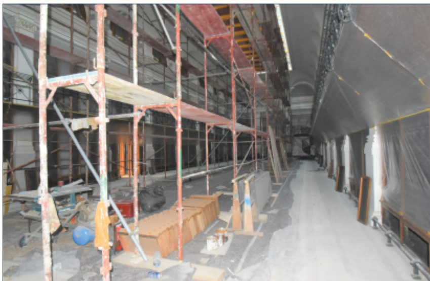
Abb. 4: Der historische Lesesaal drei Wochen vor der Eröffnung

Auch die Bibliothek wurde in diese Inszenierung miteinbezogen. Da man beim Rundgang mit den geladenen Honoratioren und PressevertreterInnen nicht vor völlig leeren Regalen stehen wollte, mussten Teilbereiche der Freihandbestände aus den Ersatzquartieren in halbfertige Räume übersiedelt werden. Die Bestückung des historischen Lesesaales mit rund 100.000 Bänden musste jedoch wegen des nicht fertiggestellten Glasdaches kurz-