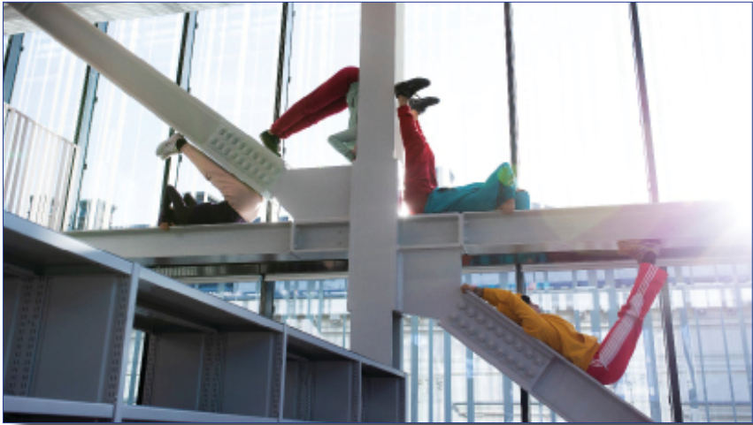
Abb. 6: SchauspielerInnen statt Bücher bei der Eröffnung; Foto: Universität Graz, Kanizaj)

Parallel zu den Notbergungen, Sicherungs- und Aufräumarbeiten im Keller- geschoß fand in den oberen Etagen die von einer Eventagentur im Auftrag der Universitätsleitung gestaltete Eröffnung der neuen Bibliothek inklusive des in das Gebäude integrierten Hörsaales mit 430 Sitzplätzen statt.