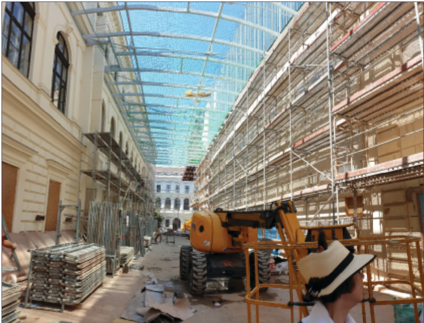
Abb. 3: Ansicht von der Errichtung des neuen Foyers zwischen Uni-Hauptgebäude links und historischem Bibliothekstrakt rechts vom 28. Juni 2019

Dutzenden ArbeiterInnen vor Ort und bei diversen Begehungen konnte man erkennen, dass nunmehr tatsächlich die Innenraumgestaltung in Angriff genommen worden war. Trotz der vermehrten Anstrengungen war aber recht bald abzusehen, dass eine Rückübersiedlung der Magazinsbestände in den Sommermonaten nicht zu bewerkstelligen sein würde, da wegen der Präsenz der zahlreichen FirmenmitarbeiterInnen und der regen Bautätigkeit in allen Räumlichkeiten keine seriösen Klimamessungen vorgenommen werden konnten. Außerdem waren bis kurz vor dem neu festgesetzten Eröffnungstermin Ende September die Magazine weder gereinigt noch verschließbar, und auch die technischen Anlagen zur Klimatisierung wurden erst unmittelbar davor eingeschaltet. Ebenso konnte die für einen geregelten Bibliotheksbetrieb unverzichtbare Buchförderanlage nicht zeitgerecht fertiggestellt werden und stand auch noch einige Zeit nach der Eröffnung nicht zur Verfügung.