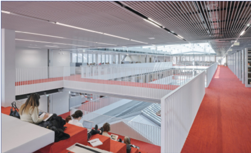
Abb. 8: Publikumsbereich 3. und 4. OG mit Sitzstiege im Vordergrund

Erstaunlicherweise wurden jedoch die hier nur beispielhaft aufgezählten Mängel von den Studierenden kaum wahrgenommen – im Gegenteil, die Räumlichkeiten wurden von Anfang an akzeptiert und in Beschlag genommen. Das vielfältige Angebot an unterschiedlichen Lern- und Arbeitssituationen fand vom ersten Augenblick an großen Anklang und es war überaus erfreulich zu sehen, dass die neue Universitätsbibliothek so großes Interesse erweckte.