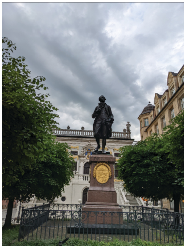
Abb. 4: Goethe vor der Alten Börse