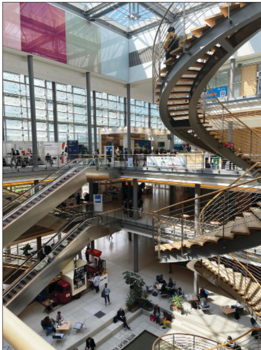
Abb. 1: Congress Center Leipzig

Der 8. Bibliothekskongress fand heuer vom 31. Mai bis 2. Juni in Leipzig statt und stand unter dem mehrdeutigen Motto „Freiräume schaffen“. Es war vor allem spürbar, wie der wiedergewonnene Freiraum, sich persönlich treffen zu können, genutzt wurde. Gleichzeitig standen wieder sehr viele spannende Themen am Programm, und die Entscheidung, welche Session man wählen sollte, fiel nicht leicht. Um wenigstens einen groben Überblick über die Fülle an Vorträgen, Workshops, Hands on-Labs und anderen Aktivitäten geben zu können, möchten einige der österreichischen Teilnehmer*innen hiermit einen Einblick in die von ihnen besuchten Veranstaltungen ermöglichen.