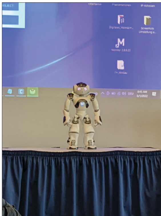
Abb. 3: Ada – NAO-Roboter der Stadtbücherei Frankfurt am Main