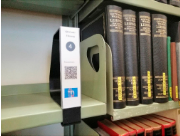
Abb. 9: QR-Code-Führung