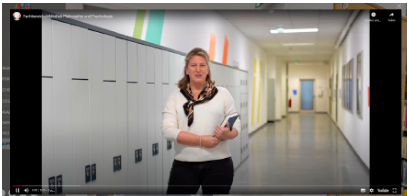
Abb. 3: Intro des Videos