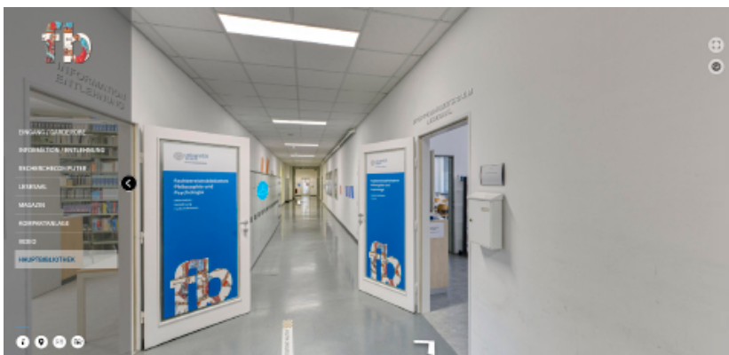
Abb. 4: Navigation über das Menü