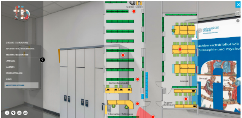
Abb. 5: Lageplan der Fachbereichsbibliothek