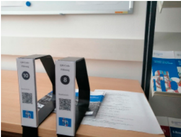
Abb. 10: QR-Code-Führung