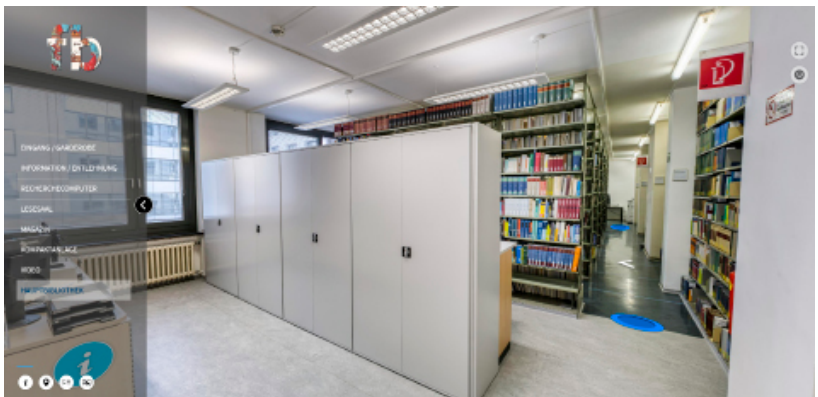
Abb. 6: Informations- und Navigationspunkte im virtuellen Rundgang