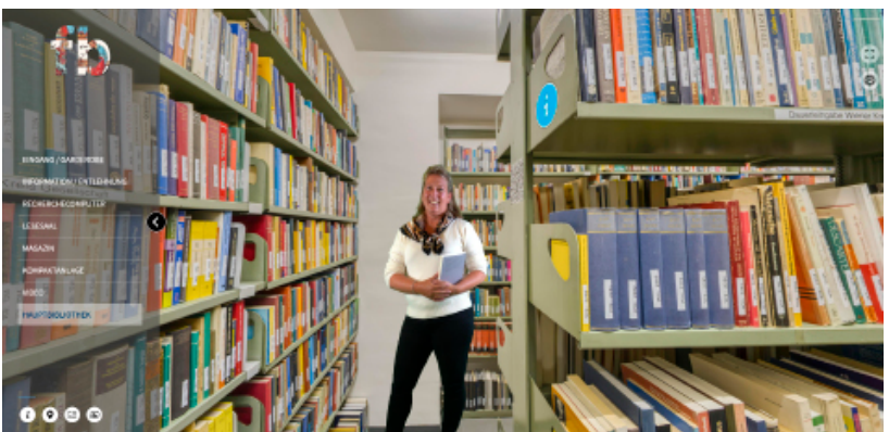
Abb. 7: Video-Kommentar zum Anklicken